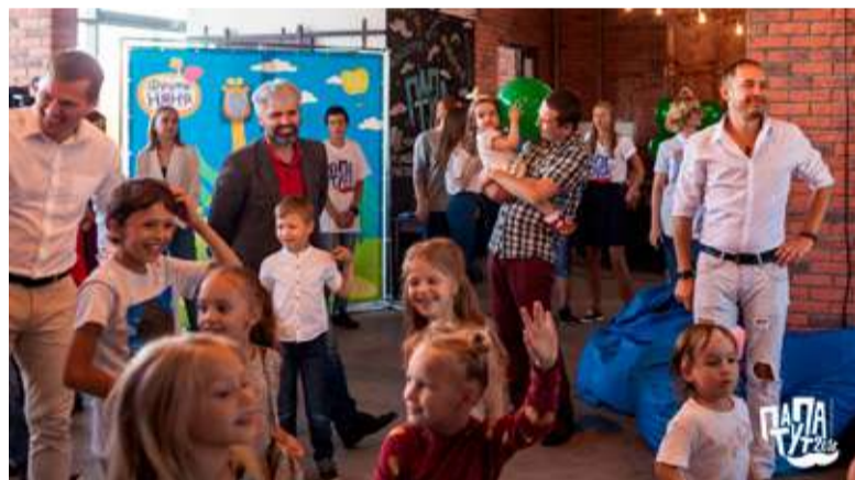
Фото центра «Моя территория»

Kassy.ru – 000 «Городские Зрелищные Кассы». 625000, г. Тюмень, ул. Первомайская, 8, оф. 304, ОГРН 1117232051991