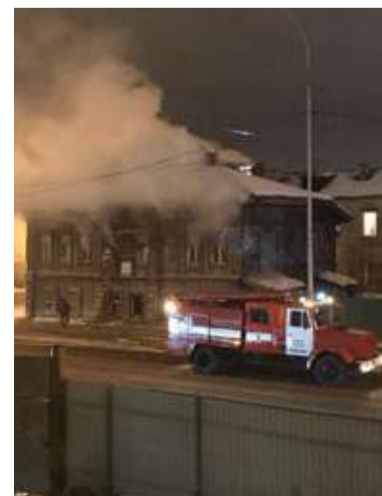
Фото из соцсетей