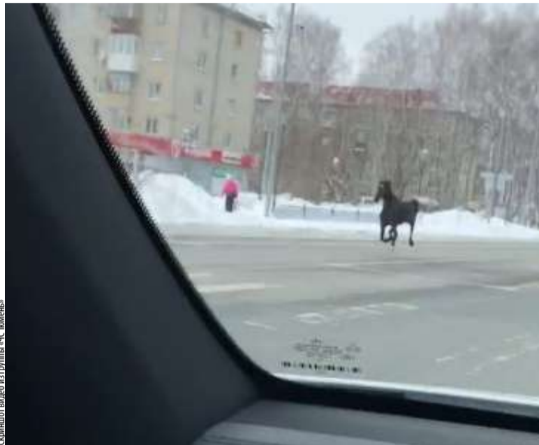
Снимокот видеозаписи «С.С. Тюмень»

По проезжей части улицы Дружбы в Тюмени 6 марта бегала лошадь темного окраса. Она не просто бродила вдоль дороги, но весело скакала, стуча копытами. Как сообщили в городской полиции, история закончилась благополучно. Оказалось, резвое животное умчалось от хозяев и решило прогуляться по городу.